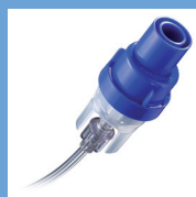
Nébuliseur SideStream usage unique par patient (remplacer après 1 mois)