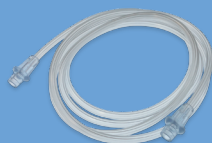
Tubulure du circuit d'air