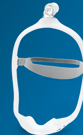
Masque DreamWear à contact minimal

Prolongez facilement votre expérience de traitement en dehors de la maison avec l'appareil de PPC nomade DreamStation Go