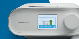
Appareil de PPC DreamStation