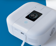
Appareil de PPC nomade DreamStation Go